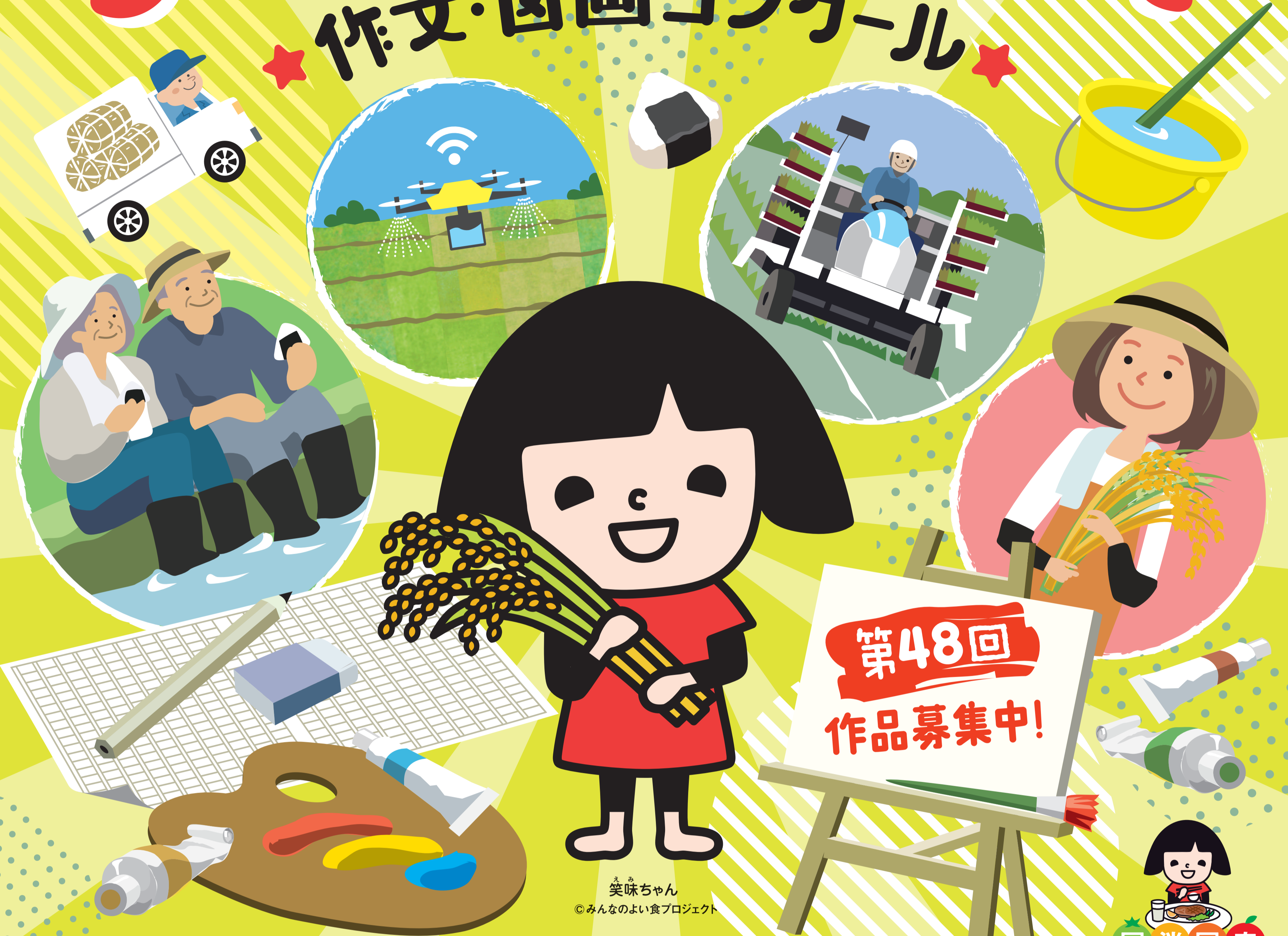
えみちゃん