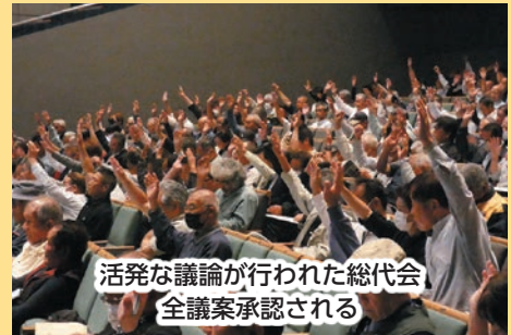
活発な議論が行われた総代会 全議案承認される