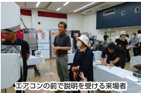
エアコンの前で説明を受ける来場者

誰もが参加しやすい活動を目指し、いただいた意見を今後の活動に活かしていきたいです。