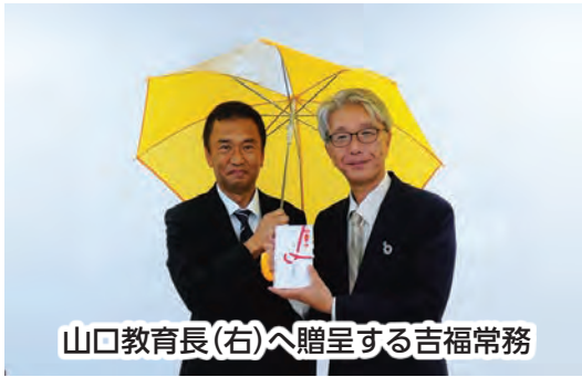
山口教育長(右)へ贈呈する吉福常務