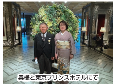
奥様と東京プリンスホテルにて

飼養管理では、飼料の食べ残しが出ないように日々観察を重ねながら調整し、一頭一頭の状態を丁寧に観察し、牛にストレスを与えない管理を徹底。長年の経験を生かした安定生産に取り組んでいます。