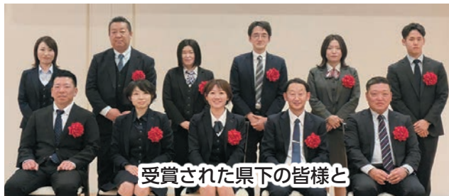
受賞された県下の皆様と