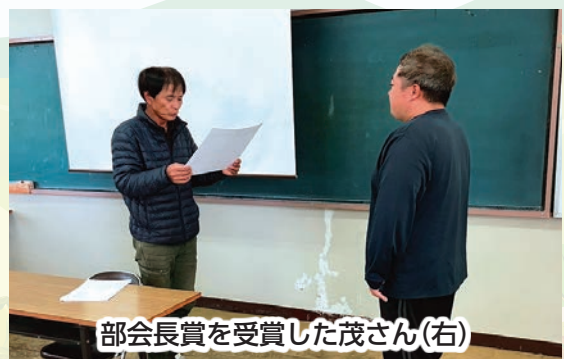
部会長賞を受賞した茂さん(右)

8年度も平均2万5,000本/10㎡、A2L率60%を目標に、需要期を中心とした長期継続出荷に取り組んでいきます。