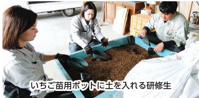
いちご苗用ポットに土を入れる研修生

全農ながさきの新規採用職員が当JAの各施設で、4月6日から2週間にわたり研修を行いました。施設見学や農業体験、青果物の選果作業などを通じて、農業やJA事業への理解を深めました。最終日に行われた報告会では、「天候に左右される農作業の難しさや、日々の積み重ねの大切さを学び、生産者の努力を今後の業務に活かしたい」との声が研修生から聞かれました。