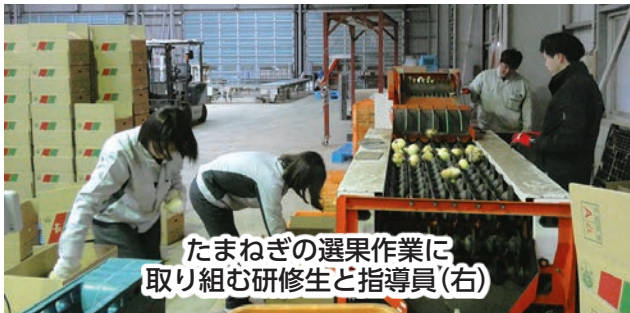
たまねぎの選果作業に取り組む研修生と指導員(右)