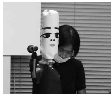
家の光記事活用体験発表会