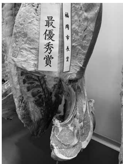
福岡食肉市場「2024年度開場記念ミートフェア」