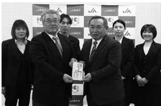
壱岐高野球部へエール