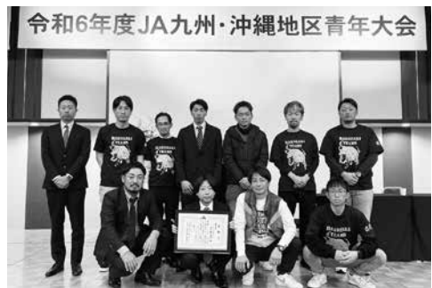
J A九州沖縄地区青年大会