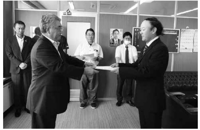
新規就農者研修事業修了式