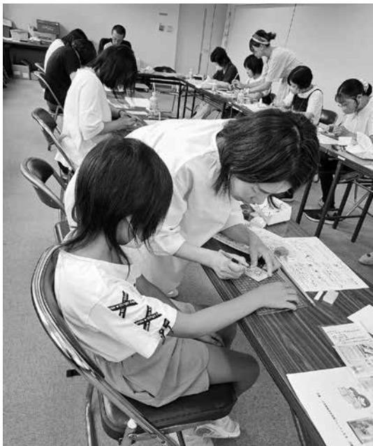
フレッシュミズ交流会