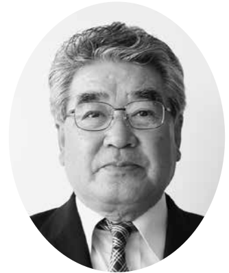
壱岐市農業協同組合 代表理事組合長

結びに、今後とも地域農業と組合員の皆様にとって、より頼られる存在であり続けるよう、役職員一同、誠心誠意努力してまいりますので、引き続き皆様のご支援とご協力を賜りますようお願い申し上げます。本総代会が実りあるものとなりますこと、そして皆様のご健勝とご多幸を心よりお祈り申し上げ、ご挨拶とさせていただきます。