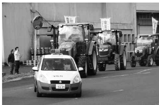
農作業安全推進活動