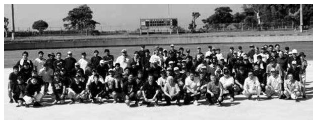
第51回青年部親睦スポーツ大会