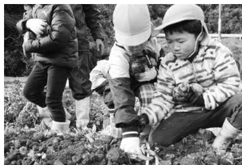
『吉岐黄金』収穫体験