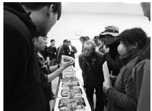
いちご出荷目揃会