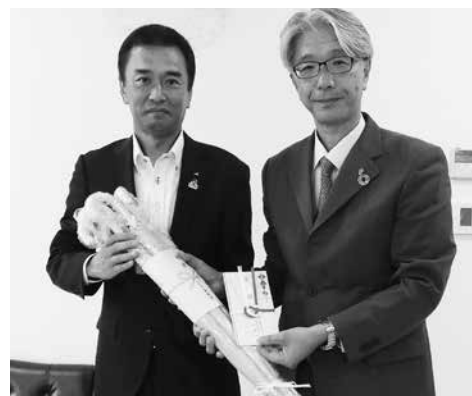
児童の安全を願って黄色の傘贈呈