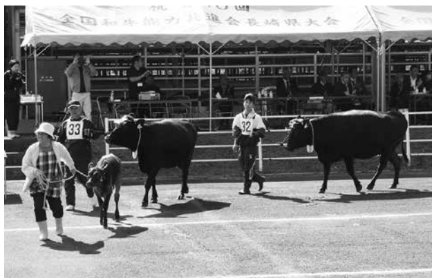
第11回沓崎市和牛共進会