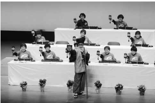
第37回大正琴教室発表会