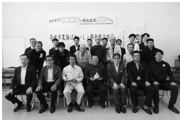
壱岐市農協ばれいしょ部会設立総会