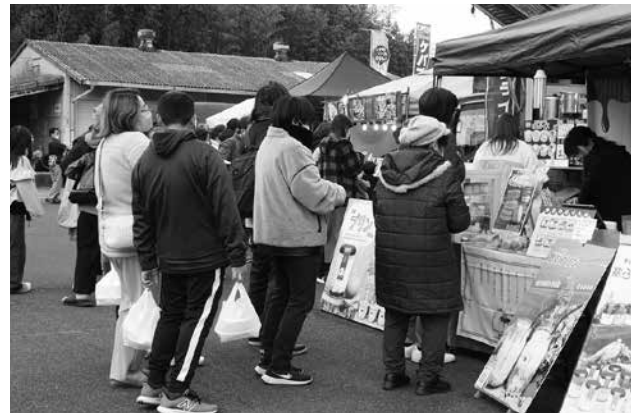
壱岐グルメフェスティバル