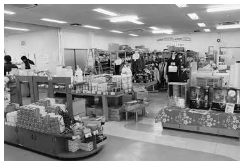
柳田資材センターリニューアル