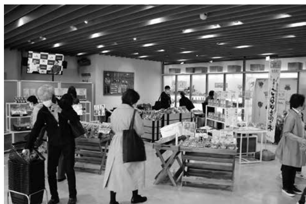
JA 東京アグリパーク 「宍岐・対馬・五島」まるごとマルシェ