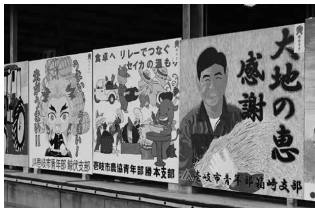
JA フェスタを彩る青年部看板作品