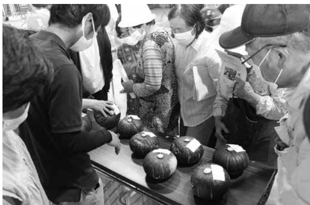
かぼちゃ出荷目揃会