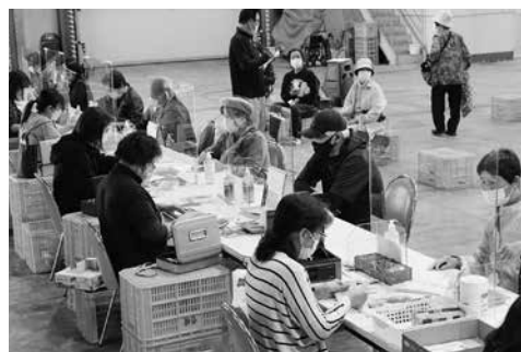
コロナ対策を講じたメロン宅配受付

また、新たな販売先としてイオン壱岐店に産直野菜コーナーを設置し、生産者から買い取りを行い販売しました。