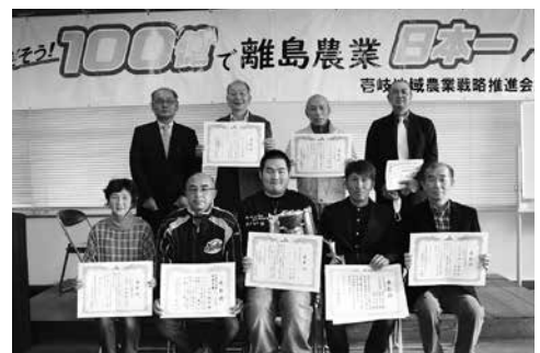
アスパラガス部会 15年連続の県下反収1位を記録