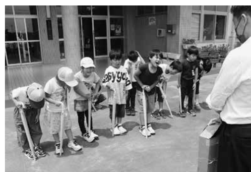
小学生に交通安全傘を贈呈