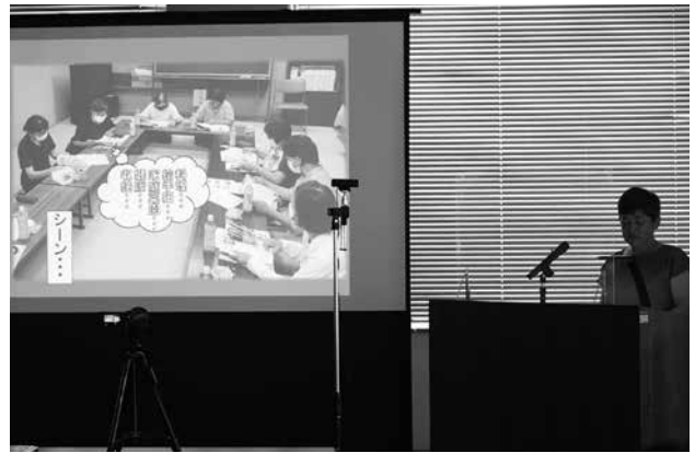
女性部家の光発表大会