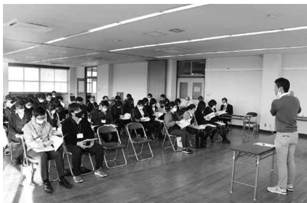
営農振興計画 全職員研修会