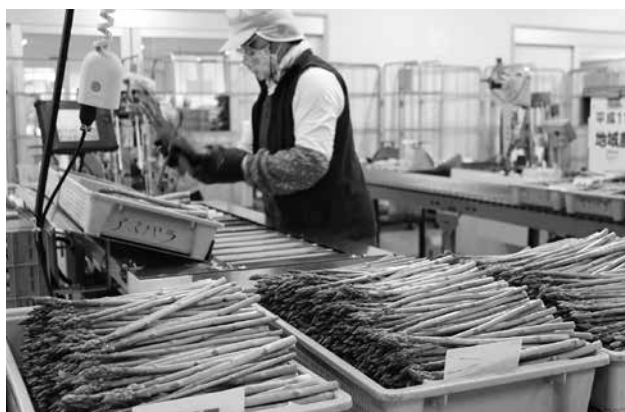
アスパラ春芽出荷スタート