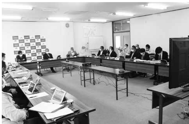
営農振興推進特別委員会