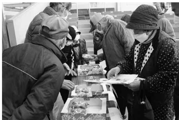
いちご中間目揃会