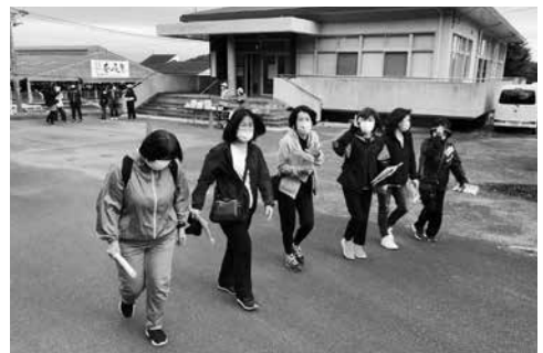
第1回目となるウォークラリー大会