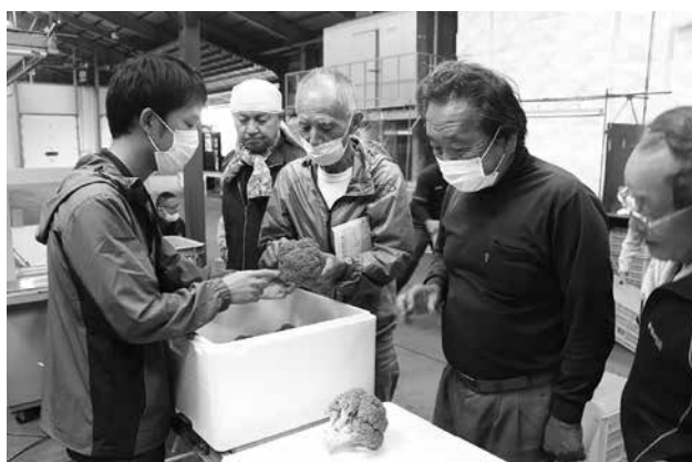
ブロッコリー出荷協議会