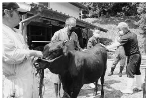
全共に向けた定期的な候補牛巡回を実施

④ ヘルパー制度を活用し、市場出荷及び各種引き出し・給餌作業に取り組むとともに、定休型肉用牛ヘルパー組合やマルチワーカーの活用により、労働時間の軽減を確立しつつあります。