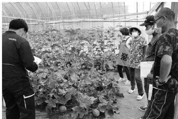
メロン現地検討会