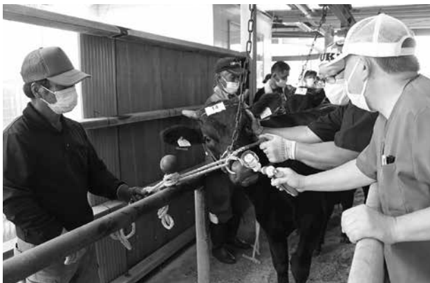
TSV-3 投与が開始された8月牛市