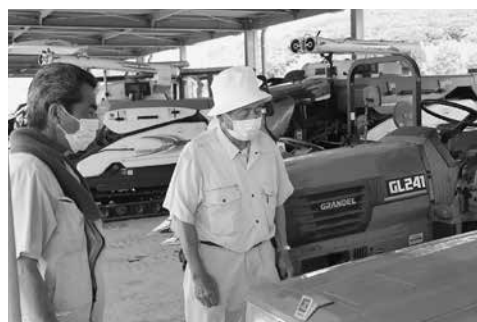
農機具・自動車フェア