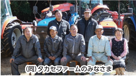
(同)タカセファームのみなさま

ながさき農林業大賞 運営委員長賞 受賞 合同会社 タカセファーム (しまの農林業経営部門)