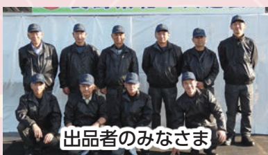
出品者のみなさま