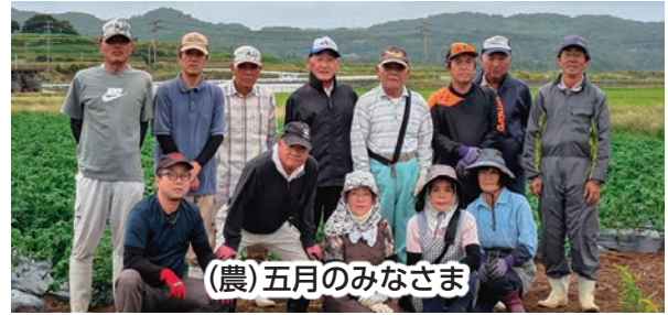
(農)五月のみなさま

日々の努力が評価されたことに感謝し、今後も壱岐の農業を守るため規模拡大を進めるとともに、若い農業者への期待を込め、共に頑張っていきたいです