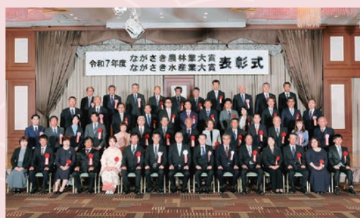
長崎県の受賞者のみなさま