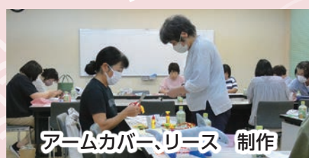
アームカバー、リース 制作