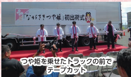
つや姫を乗せたトラックの前でテープカット

JA 壱岐市は、8月中旬より芦辺町の新共同乾燥調製施設で、令和6年産早期米の受け入れを行っています。