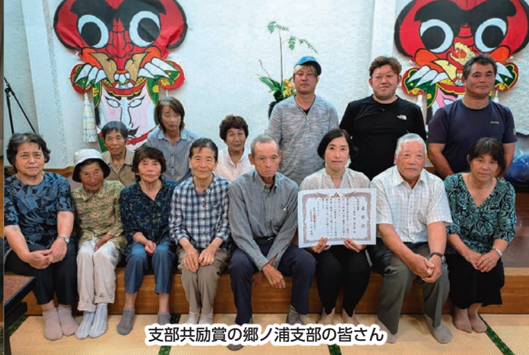
支部共励賞の郷ノ浦支部の皆さん