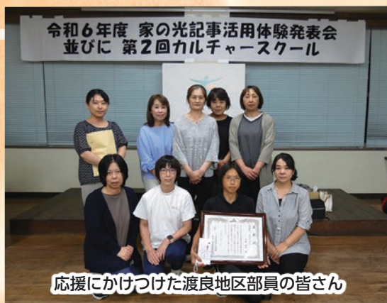
応援にかけつけた渡良地区部員の皆さん

11月12日の長崎県家の光大会で吉岐代表として発表されます。更に大きな舞台で力いっぱい頑張ってください。