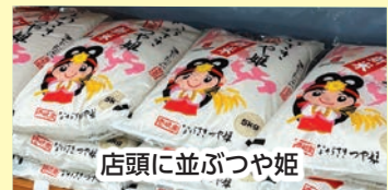
店頭に並ぶつや姫

今年もおいしい新米の季節がやってきました。アグリプラザ四季菜館の店頭には、つや姫やコシヒカリが並んでいます。収穫に感謝し、喜びを感じながら杵崎産のお米をたくさん食べてほしいですね。 (田原靖子)